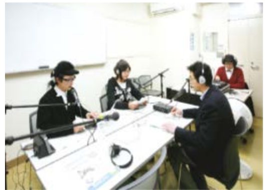
ラジオ番組「ハタラクラスぐんま」収録の様子

ラジオのサブ・パーソナリティやゲストとして登場する場合、「わかりやすく伝える」ために様々な工夫をしはじめたことである。例えば、自分のアルバイトのエピソードで「物販」という言葉がでた時に、「漢字で見れば意味がわかるが、『ぶっぱん』という発音だけならわかりにくい」という指摘が学生の間から生まれた。このように学生の間で相手を配慮したコミュニケーションのあり方の模索が見られるようになってきたのも、このインターンシップのひとつの成果であろう。