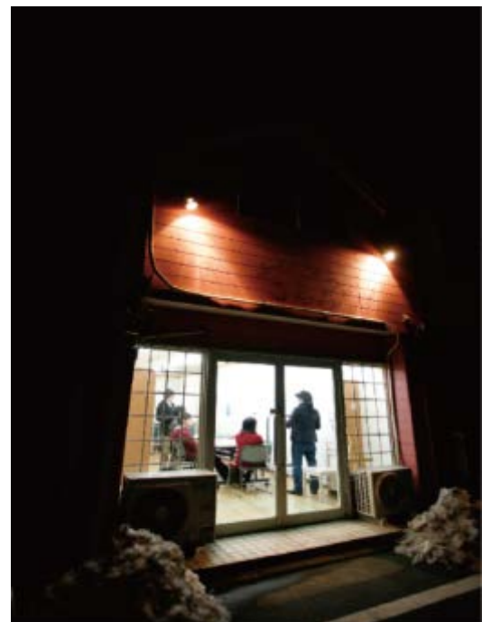
「まちなかミーティング」の様子

プロジェクト型インターンシップで展開した活動は2つある。冊子『HATARAKURASU OZE-NUMATA』とラジオ番組「ハタラクラスぐんま」の制作である。冊子は、既成の冊子の作り方にこだわらず自由なスタイルで手軽に作成する、ZINEと呼ばれる制作物である。生まれ育った文化や社会が異なる学生たちが自由な発想で、自由な色使いで編集に取り組めるようにした。それ