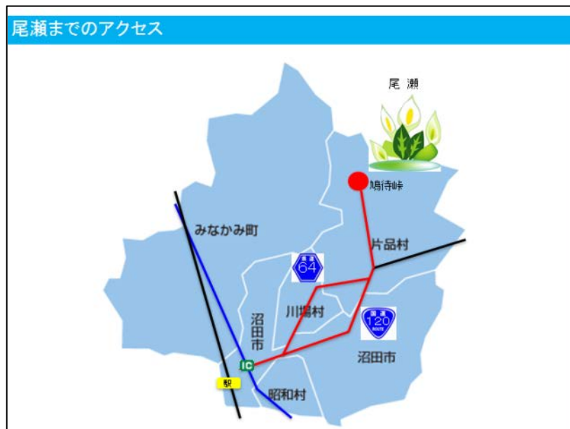
図2 学生たちが注目した着地型観光の2つのルート

9月には、上述した仮説を検証すべく、2泊3日のフィールドワークを実施した。地域に観光客を呼び込む着地型観光には、地域独自の魅力の発掘と多様なニーズに応