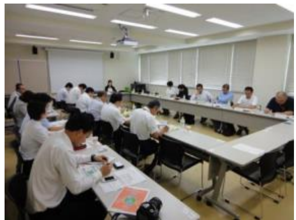
コンソーシアム協議会の様子

インターンシップ実施にあたっては、冒頭の紹介した4大学7関係機関等関係者で構成されるコンソーシアム協議会でその目的・内容・実施方法の妥当性を検証し、より充実した実施体制づくりを検討した。参加希望学生に対しては、図1に示す事前研修を実施した。対象地域となる尾瀬の情報収集と課題解決のための仮説の構築と、今回のインターンシップで必要となる現地調査の手法の学習、「着地型観光」を構想するのに必要な現地関係者のみなさんへの事前訪問とネットワークの構築をすすめた。事前指導の中で学生たちが注目したのは、成田空港、羽田空港、新潟空港から尾瀬をめざす場合、新幹線、JR、バスの乗り継ぎが必要となることから、尾瀬への入り口が群馬県「沼田」となることである。沼田から尾瀬までのルートには国道120号と県道64号の2つの街道があり、この街道沿いで生活や事業を営む人々との交流を含めることで、これまでにない尾瀬への観光ルートを「地域総力戦」で作り上げられるのではないかと。